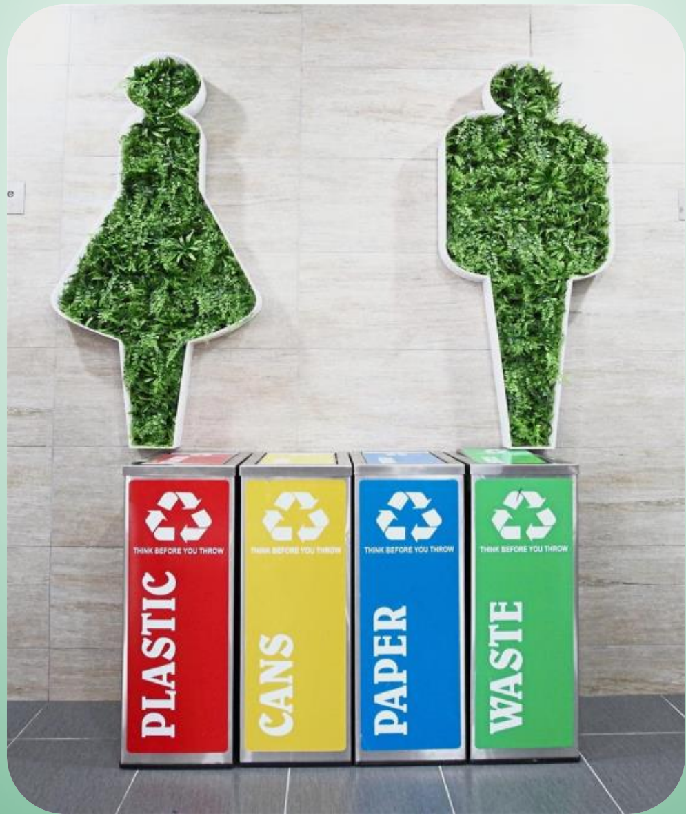
TONG KITAR SEMULA