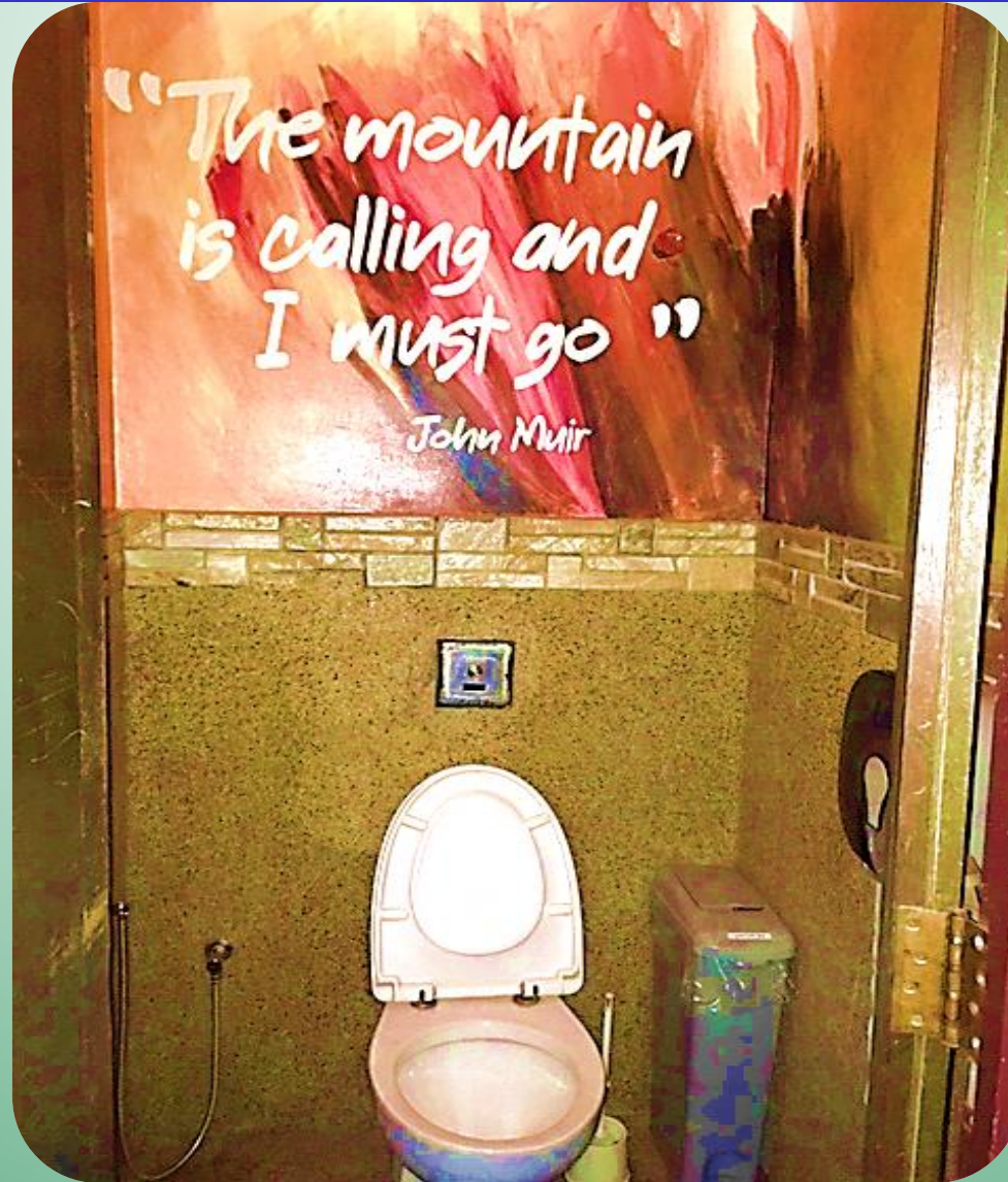
Rest. South Sea Seafood, Subang Airport