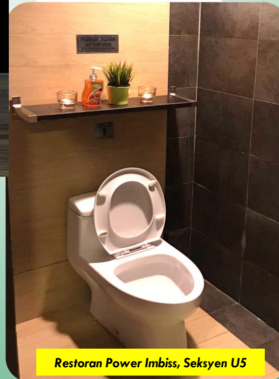
Restoran Power Imbiss, Seksyen U5