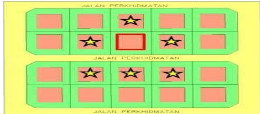
Rajah 5: Contoh Sokongan Jiran Di Rumah Sesebuah.