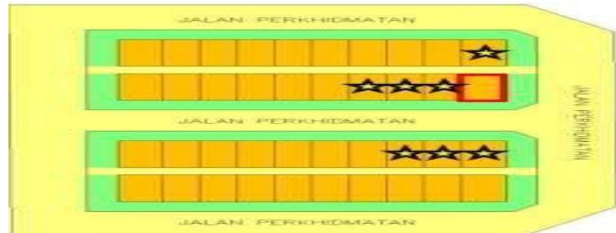
Rajah 6: Contoh Sokongan Jiran Di Rumah Bandar.