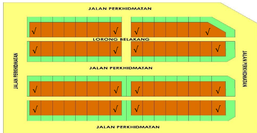
Rajah 1: Contoh Lot Rumah Teres Yang Dibenarkan.