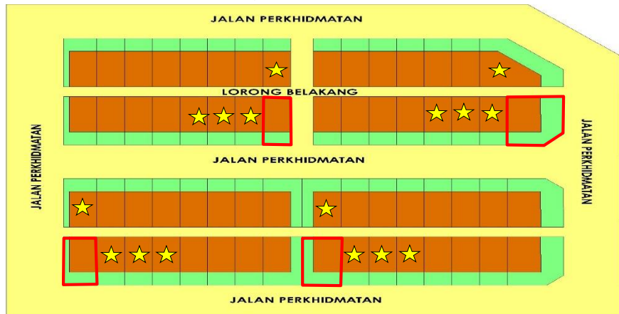
Rajah 3: Contoh Sokongan Jiran Di Rumah Teres.

7.2.1 Sokongan perlu diperolehi daripada pemunya tanah berjiran atau penduduk (penyewa). Sila rujuk Rajah 3, 4, 5 dan 6.